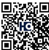
Film de présentation