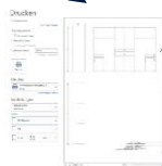
Vue à trois côtés