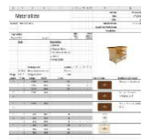
Listes de matériel